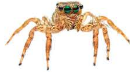
jumping spider araña saltadora