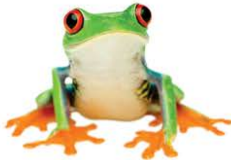
tree frog rana de árbol