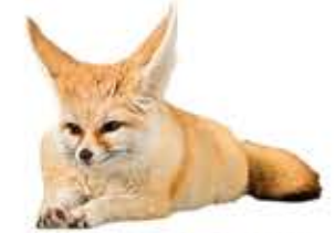
fennec fox fénece