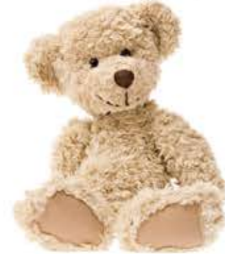
teddy bear oso de peluche